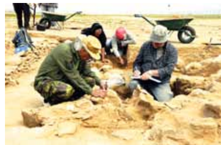
FAILAKA – ODKRÝVANIE POZOSTATKOV POSCHODIA BUDOVY.

Matej Ruttkay, Karol Pieta, Archeologický ústav SAV (krátené) | Foto: Matej Ruttkay