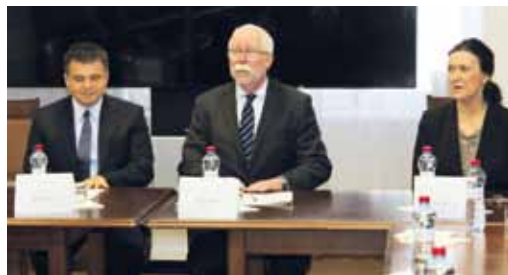
ZĽAVA MINISTER PETER PLAVČAN, PREDSEDA SAV PAVOL ŠAJGALÍK A PODPREDSEDNIČKA SAV PRE VÝSKUM EVA MAJKOVÁ