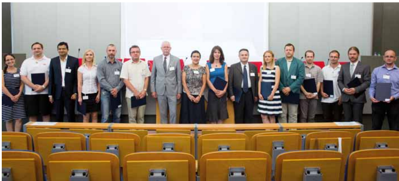
ZO STRETNUTIA VEDENIA SAV A ŠTIPENDISTOV SASPRO. AKADÉMIA OD TÝCHTO VEDCOV OČAKÁVA, ŽE SA BUDÚ VENOVAŤ ŠPIČKOVÝM PROJEKTOM.

Predstavitelia Slovenskej akadémie vied sa teda motivovaním uchádzačov o tieto granty už zaoberali. Stimuly pre tých, čo sa rozhodli so svojím projektom o ERC grant uchádzať a prešli do druhého kola, používajú vo viacerých okolitých štátoch. „Je to iste významná pomoc, keď sa môže uchádzač, ktorý v prvom kole uspel a v druhom nie, istý čas venovať zdokonaľovaniu svoj- ▶