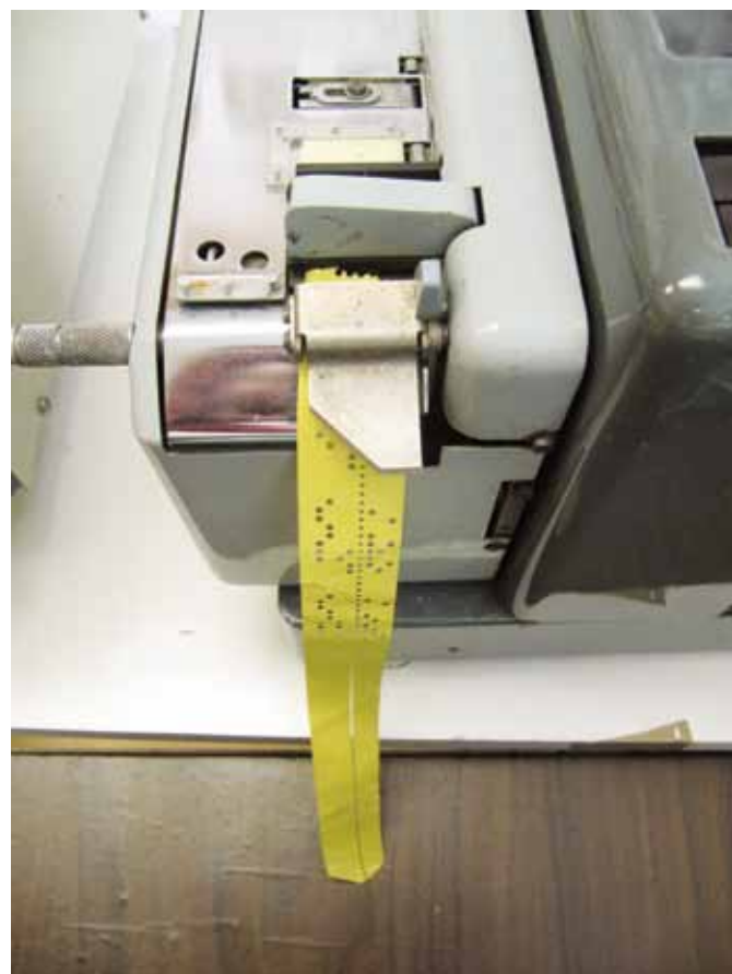
UŽ ZABUDNUTÁ DIERNA PÁSKA