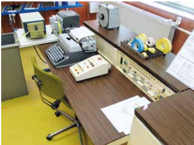
POČÍTAČ BEZ DISPLEJA, POKYNY SA ZADÁVALI NA PÍSAKOM STROJI