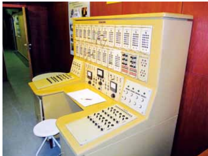
ANALÓGOVÝ POČÍTAČ SAV Z ROKU 1958

hospodárskej pomoci – poznámka redakcie] – je zo všetkých najlepších. Dokonca kvalitnejší než ich typ,“ pripomína Š. Kohút. Od roku 1974 ho vyrábali v Tesla Námestovo, neskôr ZVT (Závody výpočtovej techniky). Išlo o 16-bitový číslicový počítač, vyvinutý v rámci federálnej výskumnej úlohy Československej akadémie vied. Údaje vystupovali na dierkovaciu pásku a počítač nemal displej. Pre operátora slúžil písací stroj, ktorým zadával údaje, povely pre počítač. „Zodpovedalo to stavu technológií z roku 1973,“ usmieva sa Š. Kohút. Za sklom je vystavená zlatá medaila za počítač RPP-16 a zlatá medaila za páskový vodič chránený patentom.