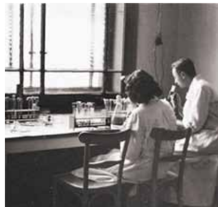
PRÁCA ŠTÁTNEJ MIKROBIOLOGICKEJ STANICE V BANSKEJ BYSTRICI (SEPTEMBER A OKTÓBER 1944)

Aby toho nebolo málo, počas nočných služieb na zdravotníckej správe hlavného veliteľstva armády začal spisovať, ako by mala vyzerat' organizácia zdravotníctva v oslobodenom Československu. Pre obsažnosť témy sa rozhodol venovať iba úseku hygienickej a protiepidemickej služby. Vychádzal zo zásady bezplatného poskytovania zdravotníckej starostlivosti a služieb obyvateľstvu, zoštatnenia lekárskej praxe, utvorenia siete protiepidemickej a hygienickej služby s laboratóriami, kde by sa všetky úkony robili pre nemocnice a terénnych lekárov zadarmo. Svoj náčrt predostrel 21. októbra námestníkovi povereníka zdravotníctva. Téma zaujala a bola odporúčená na rozpracovanie komisiou odborníkov. Na to už však nebol čas. Situácia na oslobodenom území sa prudko zhoršovala, a tak hlavnou témou zrazu bolo, ako a kam evakuovať ľudí, zariadenie a materiál.